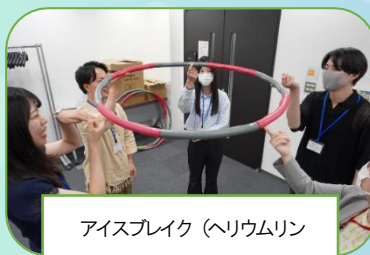
アイスブレイク(ヘリウムリング)