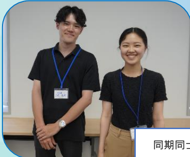
同期同士の交流風景