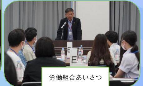
労働組合あいさつ