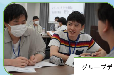
グループディスカッション