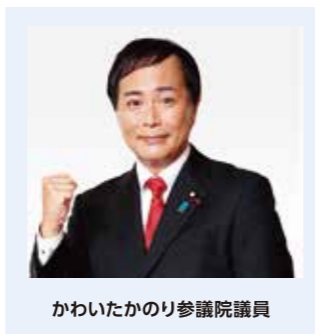
かわいたかのり参議院議員