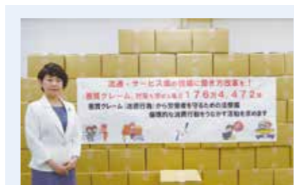
悪質クレーム対策を求める署名運動