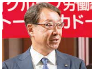
UAゼンセン 東京都支部 支部長

伝統のある定期中央大会にご参集の皆さまに、東京都支部を代表してお祝い申し上げます。組合が大きくなっていく中で、職場を起点に組合員目線で活動するイトーヨーカドー労働組合は、UAゼンセンの模範となっており、また、UAゼンセンの活動におきましても、多くの役割を担っていただき、全国各地でご活躍いただいております。