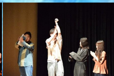
【新入組合員プレゼンテーション】 全20支部の作品を発表