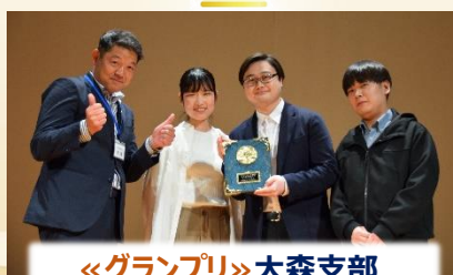
「グランプリ」大森支部