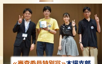
「審査委員特別賞」木場支部