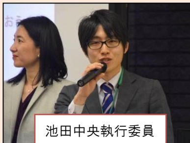
池田中央執行委員