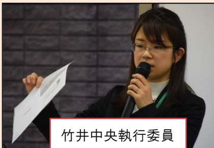
竹井中央執行委員